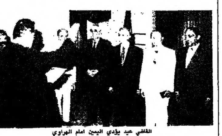
القاضي عيد يؤدي اليمن امام الهراوي

بموجب الرسوم رقم ١٧٨ تاريخ ١٩٩٠/٨/٢٠ يكون مجلس القضاء قد اكتمل. وكان مجلس القضاء الاعلى قد عقد جلسته الاولى يوم السبت الماضي في اثر أداء اليمين من قبل رئيسه وخمس من اعضاءه، والتي، بناء على اقتراح وزير العدل، تمحيط السيد عيد وزين، ورئيسين في محكمة التمييز، كما نوه مجلس القضاء بالجهود التي بذلها رئيسه السابق الشيخ امين نشار مدة اضطراره بالرئاسة في خدمة القضاء والعدالة. وقد اعربت المراجع القضائية واساطع المحامين في جميع انحاء لبنان عن ارتياحها التام لما جرى من تعيينات في المراكز القضائية الاساسية، وإعادة تأليف مجلس القضاء الاعلى، وفقاً للمبادئ الموضوعية والملائمة الوظيفية التي تضمنت الخطى العلمية والمثقفية والقضائية المجددة.